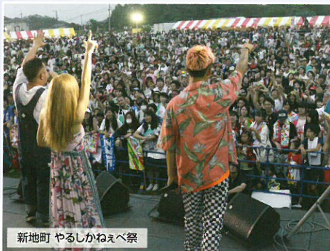
新地町 やるしかねえべ祭