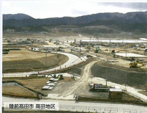
陸前高田市 高田地区